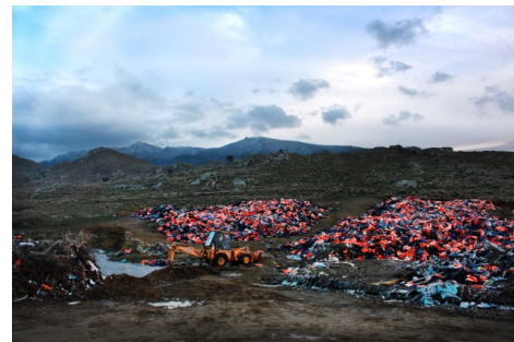
'Lifevest graveyard', Lesvos

Scenario & Regie: Els van Driel & Eefje Blankevoort Research: Zuhoor Al Qaisi